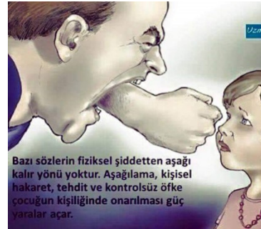
Bazı sözlerin fiziksel şiddetten aşağı kalır yönü yoktur. Aşağılama, kişisel hakaret, tehdit ve kontrolsüz öfke çocuğun kişiliğinde onarılması güç yaralar açar.

Araştırmalar duygusal istismarın en yıkıcı ve en yaygın istismar türlerinden biri olduğunu, çocukluk döneminde duygusal istismara maruz kalan çocuklarda birtakım duygusal, davranışsal, gelişimsel ve sosyal bozuklukların ortaya çıktığını göstermektedir.